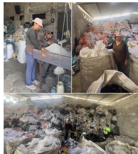
Banco Pichincha, Ecuador 13