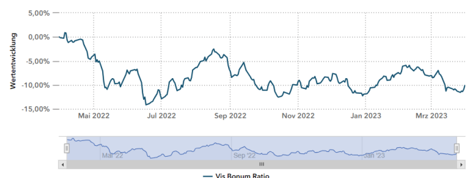
Brutto Wertentwicklung nach BVI von 31.03.2022 bis 31.03.2023 (Täglich).

Die Wertentwicklung im Geschäftsjahr beträgt am 31.03.2023 -10,12 %.